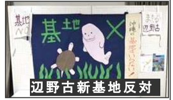
辺野古新基地反対