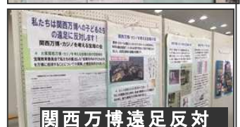
関西万博遠足反対