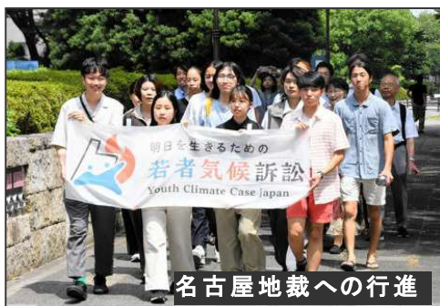
名古屋地裁への行進

8月6日に深刻化する気候変動を食い止めようと、全国の15~29歳の若者16人が、大手電力会社など10社を相手に、国際目標の達成を妨げるような温室効果ガスの排出の差し止めを求めて名古屋地裁に提訴した。(朝日新聞 8/6)