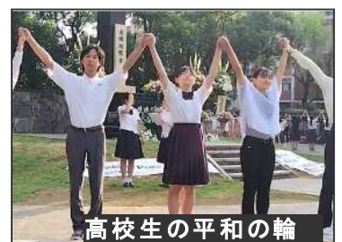
高校生の平和の輪

長崎では9日、高校生を中心に約100人の若者が「原爆落下中心地碑」を囲み平和を願う「平和の輪」を作り、「原爆や核兵器が使われないように行動する」と語った。