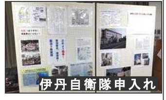
伊丹自衛隊申入れ