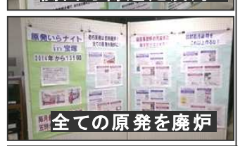
全ての原発を廃炉