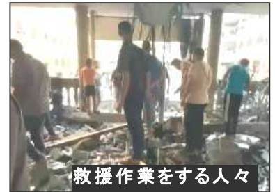
救援作業をする人々

イスラエル軍は8月10日に家屋を破壊された住民と子どもが身を寄せている北部ガザの学校を空爆、100人以上が死亡した。停戦交渉がエジプトや米国によって呼びかけられ15日から開始されようとしているが、まさにそれを妨害し、ガザ・ジェノサイドを続ける意図である。イスラエルは先月には、ハマスの最高幹部をイランで殺害するなど、「戦争終わらせない」意思を示している。15日には爆撃による死者は4万人を超えた。欧米諸国はイスラエルに殺人の武器を供給するな！即時停戦を要求しよう。