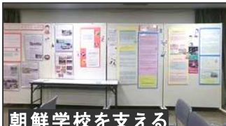
朝鮮学校を支える

宝塚の各分野 で活動される14団体の展示は、初めて知る事実と地道な闘いを知ることができる素晴らしい機会であった。ぜひ来年も、より拡大し開催をめざしたい。