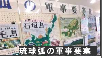
琉球弧の軍事要塞