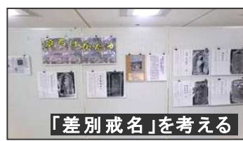
「差別戒名」を考える