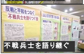
不戦兵士を語り継ぐ

セミナー室 には「朝鮮学校を支える宝塚市民の会」、「日本軍『慰安婦』被害女性と共に歩む阪神連絡会」の展示が並べられた。「伊丹自衛隊への申入れ行動」、「宝塚宗教者・市民 平和会議」の『差別戒名』を考える、宝塚での神戸水道建設工事等で亡くなった朝鮮人犠牲者の「慰霊碑を守る会」の展示。そして「原発いらナイト in 宝塚」、「原発の危険性を考える宝塚の会」、そして「沖縄辺野古に新基地を絶対つくらせない行動 in 宝塚」のジュゴンの展示が壁を飾った。