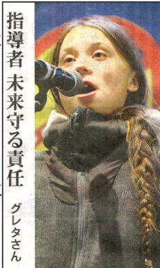
指導者未来守る責任 グレタさん

日本では今年の原子力産業協会で、今井会長は「国際社会で役割を果たすためには、CO 2 を排出しない原発の活用」を訴えた。それに対して、国立環境研などの