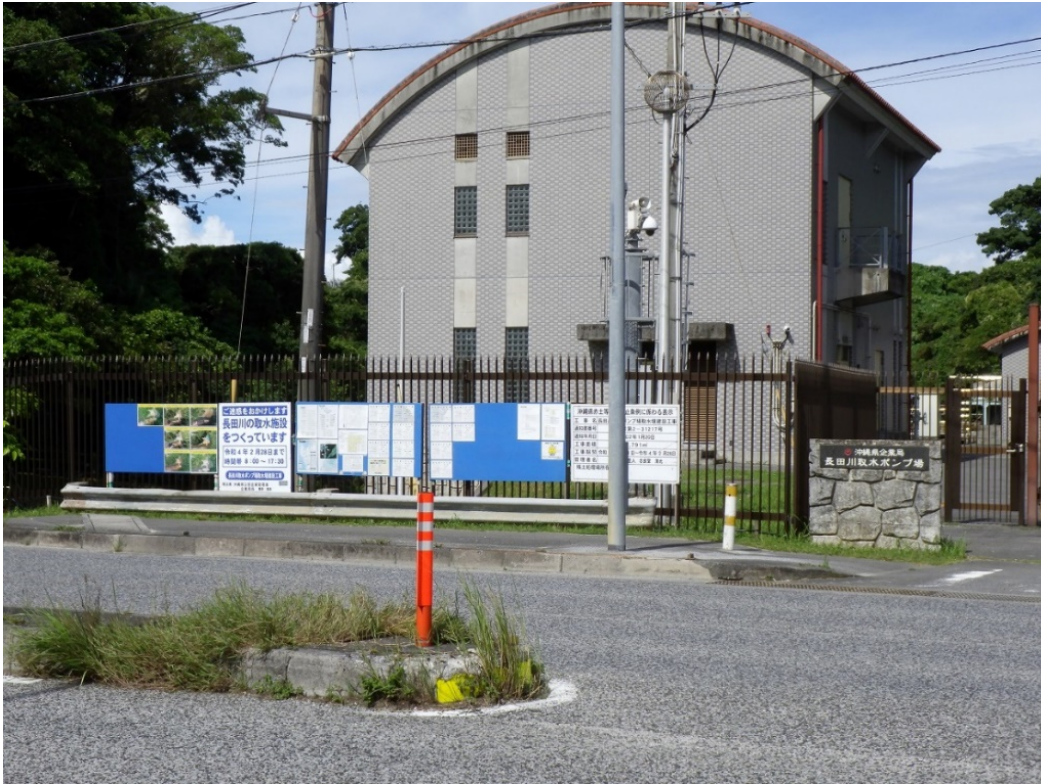
(建設進む長田川取水ポンプ場) (2021年6月11日)