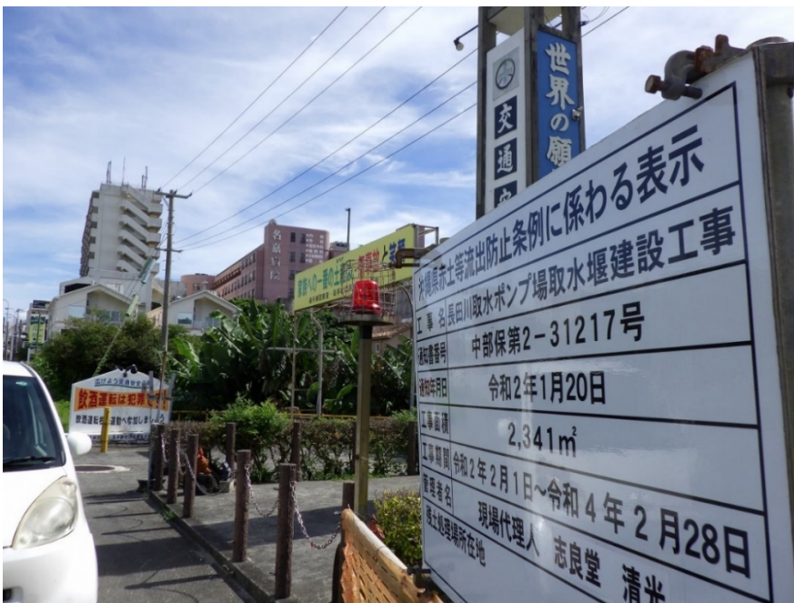
(長田川は、汚染河川の比謝川と繋がり、その合流点に取水ポンプ場建設が進むが、公衆衛生上、大丈夫なのだろうか?)