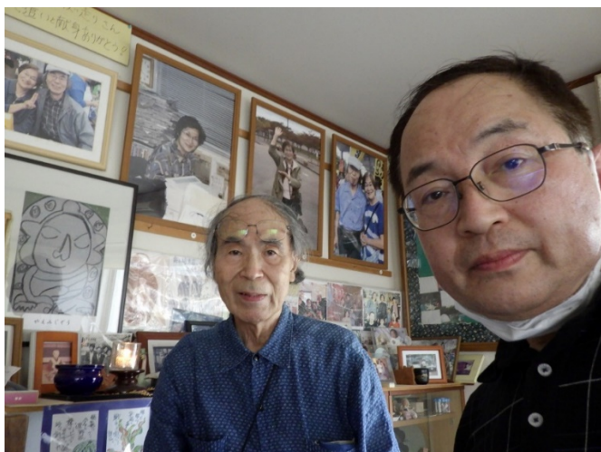
（矢ヶ崎先生のご自宅を訪ねて）

例えば、日本の原賠訴訟での司法がしばしば典拠とする国際組織（IAEA；IRCRP；UNSCEAR など）は、世界の原子力産業を支える側にあると看破されるし（11-12頁、80頁以下）、福島放射能被害の「因果関係」の立証は難しいとされつつも、福島県の死亡率の高さに言及され（62頁以下）、数多くの健康障害（死産、周産期脂肪、乳児死亡、甲状腺癌、先天性奇形、精神神経系、心筋梗塞など）などを、積極的に評価されるのも、教授ご夫妻の個人的な体験も関係しているように思われる。というのは、福島の放射能事故間もなく、ご夫妻で福島入りされて、献身的な放射能測定の日詰りであろうか、2013年1月には、最愛の奥様を心臓発作で亡くされ 2) 、自らも、2013年から14年にかけて、硬膜下血腫に襲われる経験も、この実態把握には寄与していると推察する。東日本大震災直後は、あれだけ放射能汚染は恐れられたのに、その風化の著しい昨今、再度この警告の書を居住福祉学上も留意すべきことをお願いしたい。